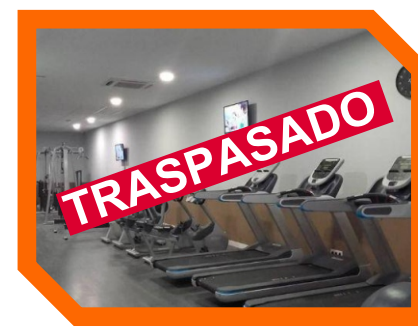
CALLE GRABADOR ESTEVE - VALENCIA