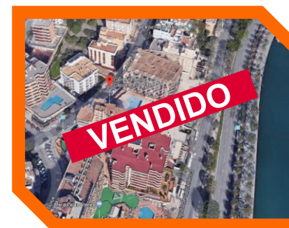
CALLE LORCA PALMA DE MALLORCA