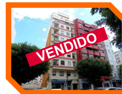
CALLE SAN VICENTE - VALENCIA