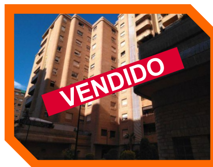
CALLE GUARDIA CIVIL - VALENCIA

En estos casi 30 años, superando las mayores crisis, hemos ayudado a casi 3000 personas a encontrar la casa de sus sueños, y , a más de 2000 a vender sus propiedades con éxito, de forma rápida, segura y rentable.