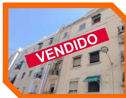
CALLE MONTICHELVO VALENCIA