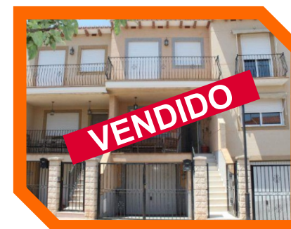
CALLE TOSCAL VIVER

Nuestro trabajo y nuestros resultados son nuestro mayor aval